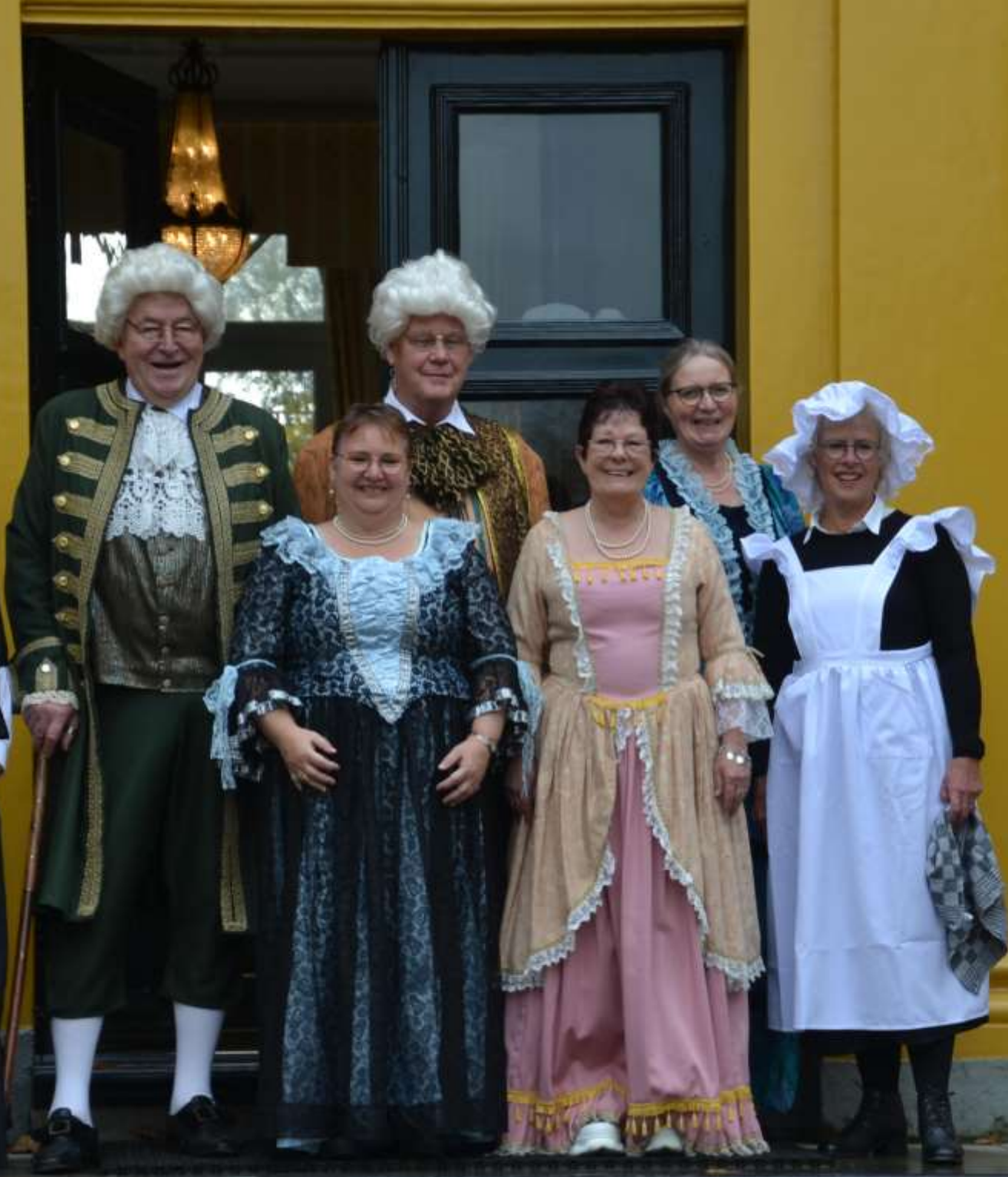
Oude tijden herleven bij de Freylemaborg